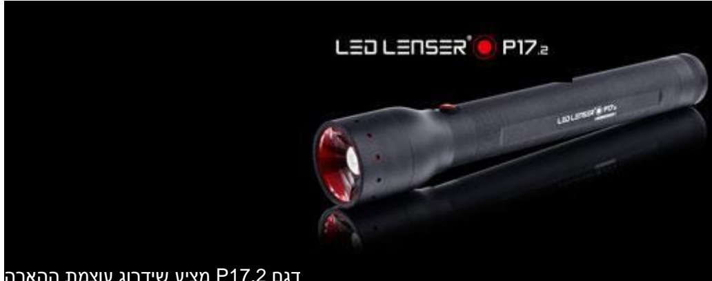
דגם P17.2 מציע שידרוג עוצמת הארה